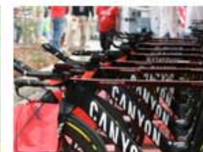
CURIOSITY FROM THE GIRO 3